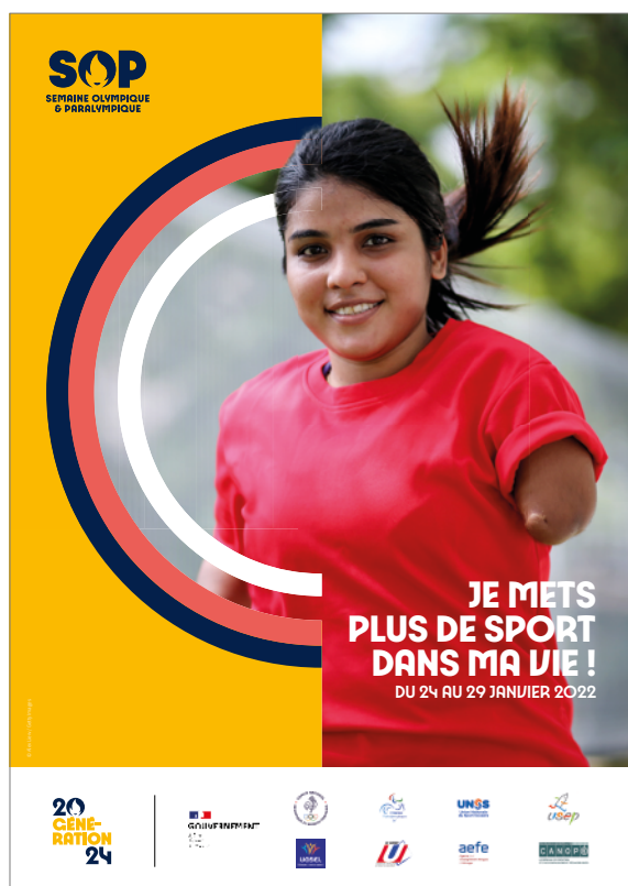
Affiche du Kit SOP

Un kit de communication est mis à disposition des inscrits à la Semaine Olympique et Paralympique. Ce dernier comprend des affiches à imprimer ainsi que des visuels pour communiquer sur les réseaux sociaux. Il est également possible d'imprimer un diplôme de participation à remettre à tous les participants.